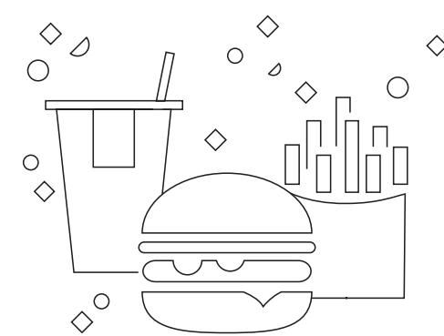
TABELA ALERGENÓW I WARTOŚCI ODŻYWCZYCH